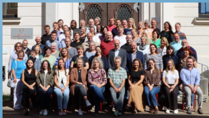
Das Lehrerkollegium 2025/26